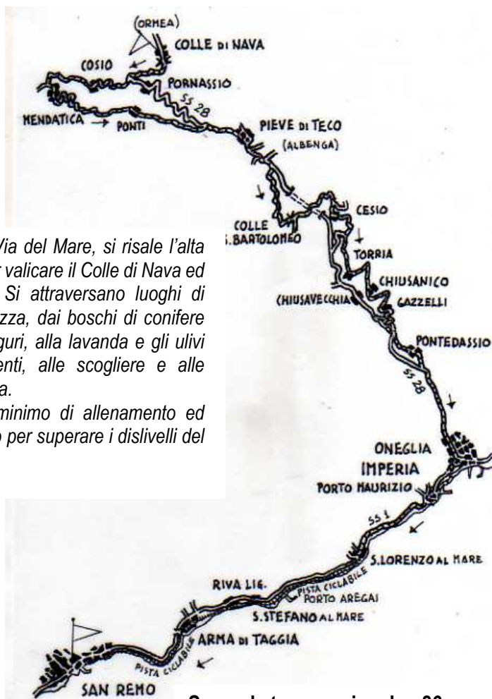
Seconda tappa – circa km 86 e 1.269 metri di dislivello in salita

Ultimo tratto della Via del Mare, si risale l'alta valle del Tanaro per valicare il Colle di Nava ed entrare in Liguria. Si attraversano luoghi di incomparabile bellezza, dai boschi di conifere e faggi delle Alpi liguri, alla lavanda e gli ulivi lungo i terrazzamenti, alle scogliere e alle spiagge della Riviera.